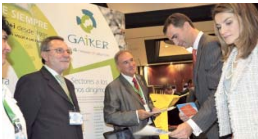
Los Príncipes de Asturias visitaron el stand de GAIKER-IK4

Así, en el transcurso de este evento que contó con la participación de cerca de 60 personas procedentes de un total de 40 empresas, se profundizó en las implicaciones de la aplicación de las nuevas legislaciones sobre la construcción y los sectores anexos, materias, diseño, etc., y se presentaron las nuevas modificaciones a dichas legislaciones. Entre las nuevas especificaciones se destacaron las relativas al comportamiento al fuego de los materiales, ya que las normas de ensayo de reacción al fuego se encuentran actualmente en revisión y su actualización está prevista para 2009.