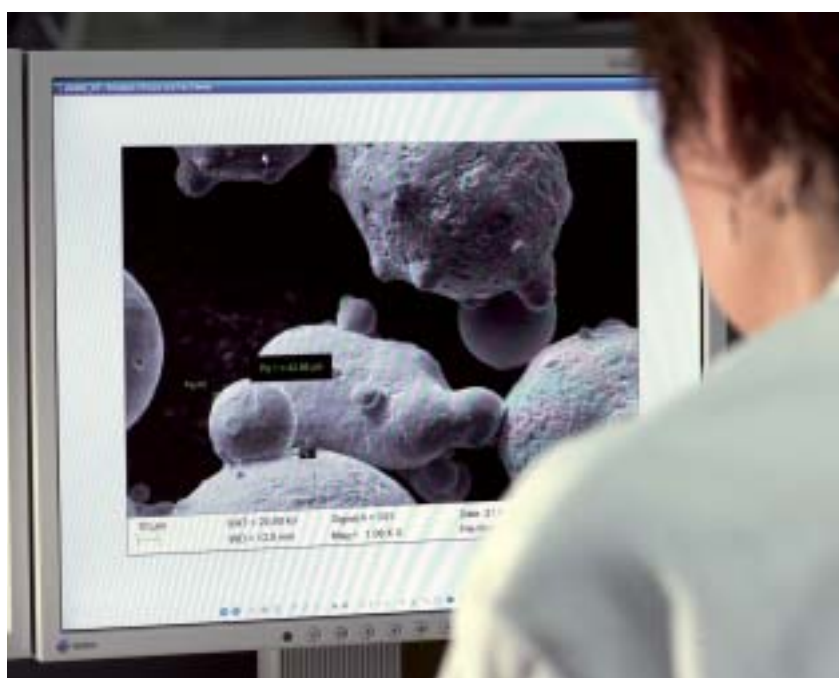
Análisis microscópico de nanopartículas

GAIKER-IK4, que cuenta con una dilatada experiencia en la investigación y el desarrollo de herramientas para la detección precoz de cáncer y otras