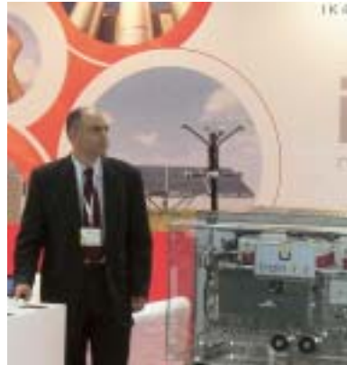
Stand de IK4 en EFEF 2009

El pasado mes de abril acudimos a Hannover Messe 2009 , un evento que agrupó a 14 ferias internacionales. Nuestra presencia en este evento, en el que estuvimos presentes junto con otros Centros Tecnológicos en el stand de Fedit y con el apoyo del ICEX, nos permitió presentar nuestra oferta tecnológica, así como establecer contactos comerciales y conocer de primera mano las últimas tendencias en una gran variedad de ámbitos: las microtecnologías, la energía, o las Tecnologías de la Información y la Comunicación, entre otros.