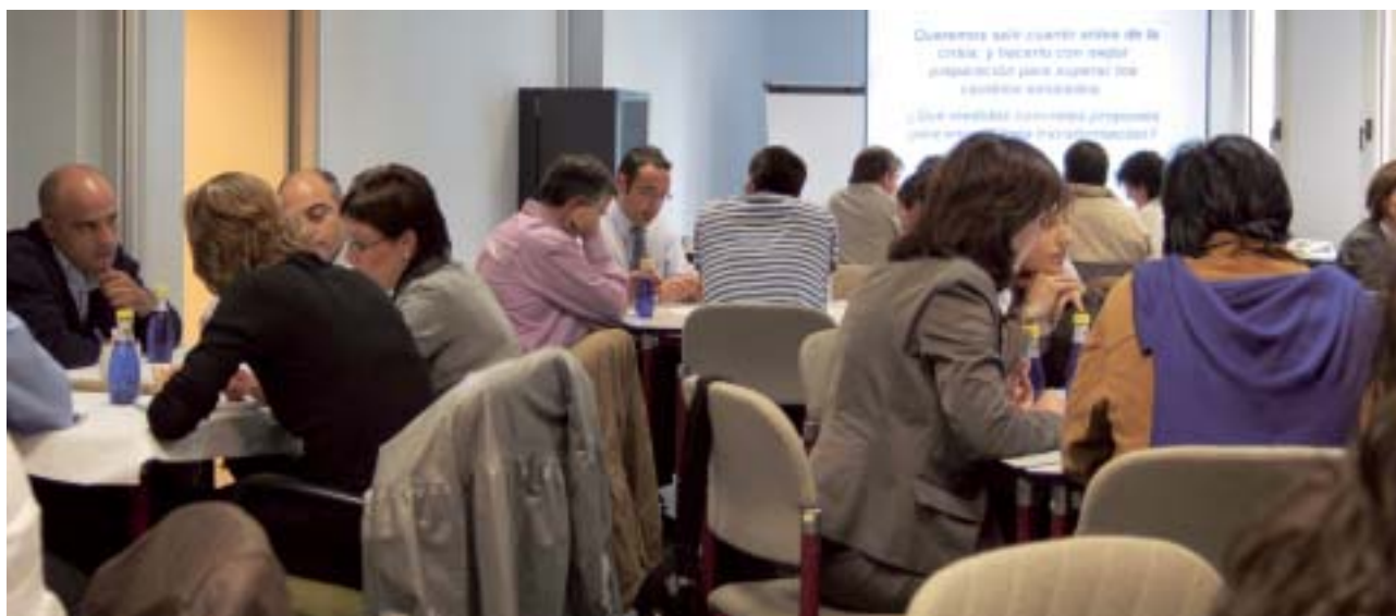
Miembros de los Centros de la Alianza IK4 en el Work Café celebrado en GAIKER-IK4

IK4 se sumó al Proyecto de Innobasque, WOKA Euskadi, para debatir sobre la crisis y proponer posibles soluciones