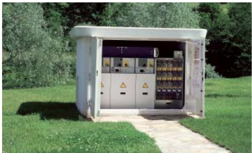
Centro de transformación

El proyecto de I+D+i, CRISÁLIDA, (Convergencia de Redes Inteligentes y Seguras en Aplicaciones Eléctricas Innovando en Diseño Ambiental ), en el que participa GAIKER-IK4, surge en este contexto con el objetivo de realizar una investigación de carácter estratégico en el campo de la distribución secundaria de energía eléctrica, que permita obtener conocimientos multidisciplinares para el desarrollo de un nuevo concepto de red de media tensión en el horizonte 2015. Subvencionado por el Centro para el Desarrollo Tecnológico Industrial (CDTI) en el marco del Programa CENIT (Consortios Estratégicos Nacionales en Investigación Técnica), pertenece al programa Ingenio 2011. Con cerca de 23 millones de euros, las estrategias principales en torno a las que se articula este gran proyecto de investigación industrial son tres: seguridad de los centros de transformación, calidad y garantía del suministro eléctrico y diseño de equipos con menor impacto medioambiental. El consorcio del proyecto CRISÁLIDA está integrado por 15 socios industriales de