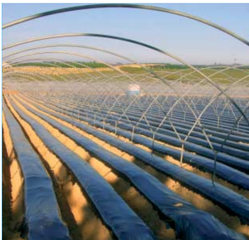
Instalación de acolchado plástico en una explotación agrícola en Huelva

Estas experiencias piloto han sido evaluadas técnica, económica y medioambientalmente y comparadas con las desarrolladas en Italia, Francia y Grecia, con el fin de validar el sistema de gestión de residuos de plástico agrícola propuesto.