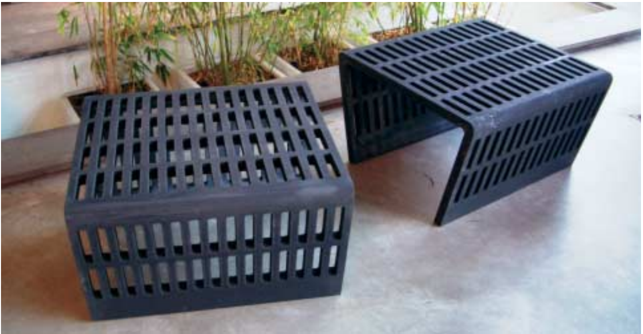
Prototipo de banco realizado en el marco del proyecto de I+D+i