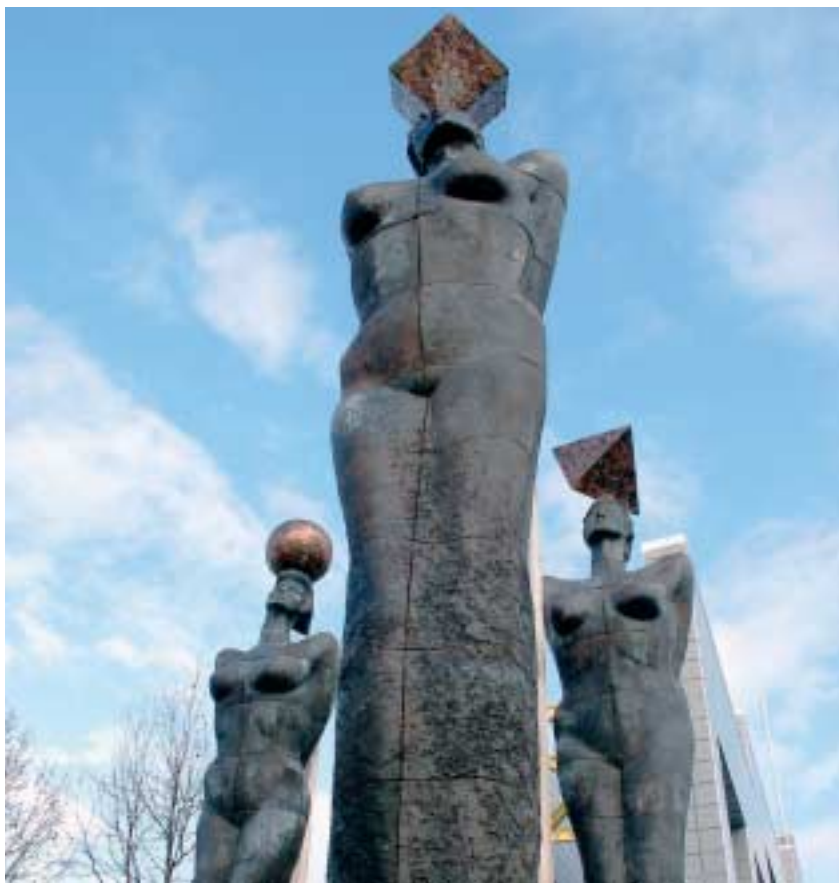
Las cariátides que presiden las instalaciones de GAIKER-IK4

En el período 2005-2008, GAIKER-IK4 desarrolló cerca de 280 proyectos de I+D+i. De esta cifra, 147 correspondieron a proyectos bajo contrato con empresas, 105 a proyectos de generación y captación de conocimiento propio y 28 a proyectos europeos.