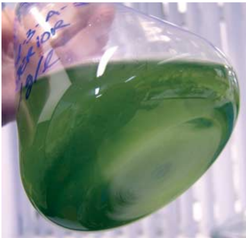
Muestra de cultivo de microalga marina

Investigamos en el aprovechamiento energético de microalgas para obtener productos energéticos renovables