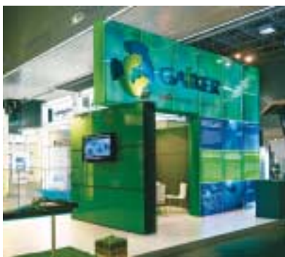
Stand de GAIKER-IK4

El interés por los fluidos en estado supercrítico ha crecido de forma significativa en los últimos años. De hecho, ya encuentran aplicación en sectores industriales como la alimentación, el cosmético, el farmacéutico y nutracéutico, materiales plásticos, textil, limpieza de materiales, tratamiento de residuos etc. También cubren líneas emergentes de actuación como la nanotecnología, campo en el que muestran notables ventajas frente a las tecnologías convencionales.