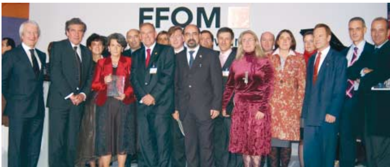
La Delegación de GAIKER-IK4 y representantes institucionales posan con el galardón