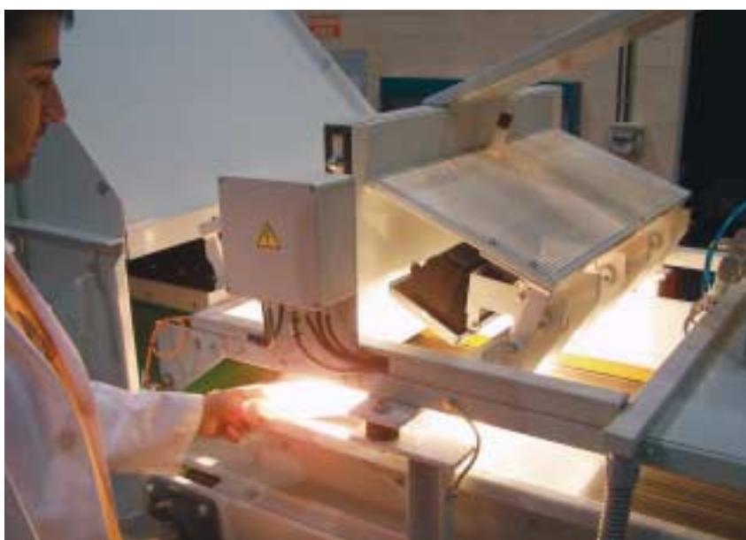
Equipo de identificación y separación NIR

En la actualidad, las dos unidades de identificación NIR con las que contamos en el Centro (un equipo Kusta 4004 de la firma LLA, con capacidad para funcionar en modo automático, y un equipo iosys portátil) nos permiten continuar investigando en la adaptación de esta tecnología a nuevos materiales, como los biopolímeros y productos que presenten una problemática especial, tales como los envases multi-material, además de en su aplicación a corrientes de materiales específicos, tales como los textiles. Trabajamos también en la identificación de materiales de colores oscuros, principal limitación de la tecnología NIR.