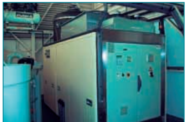
Planta de tratamiento de aguas residuales desarrollada en el marco de colaboración UNIÓN TOSTADORA-GAIKER