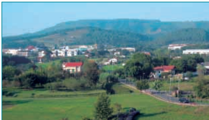
Vista general del Parque Tecnológico de Bizkaia, donde GAIKER está ubicado

Las primeras experiencias en "ecoparques industriales", una de las aplicaciones de la ecología industrial y tema principal de la Jornada, han apuntado ya importantes ventajas tanto para las empresas ubicadas en estos parques como para su entorno