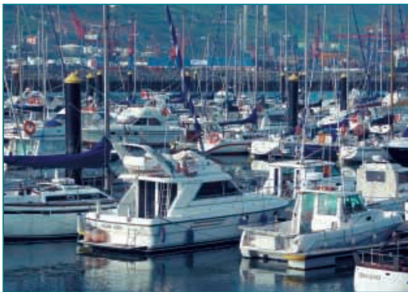
El sector naval es uno de los sectores más interesados en la tecnología de infusión

Entre las ventajas que aporta esta tecnología destacan: