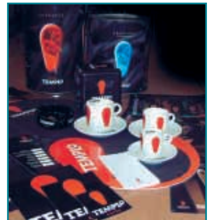
Muestra de productos de marca propia de UNIÓN TOSTADORA

GAIKERrek eskarmentu handia du nekazaritza-elikagaie-tarako azpiproduktuen eta uraren tratamenduan. Horri esker, zentro hau izan da UNIÓN TOSTADORAk auke-ratutako eragile teknologikoak, bere hondakin likidoak kudeatzeko irtenbiderik onena bilatzeko orduan.