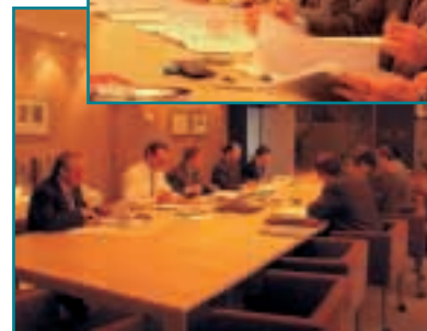
Miembros del Patronato en la reunión celebrada el pasado 12 de mayo